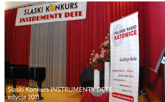
Śląski Konkurs INSTRUMENTY DĘTE edycja 2011