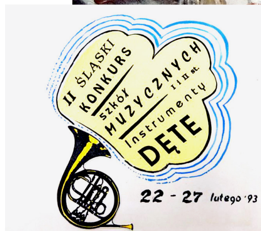
Identyfikacja wizualna II Śląskiego Konkursu Szkół Muzycznych INSTRUMENTY DĘTE